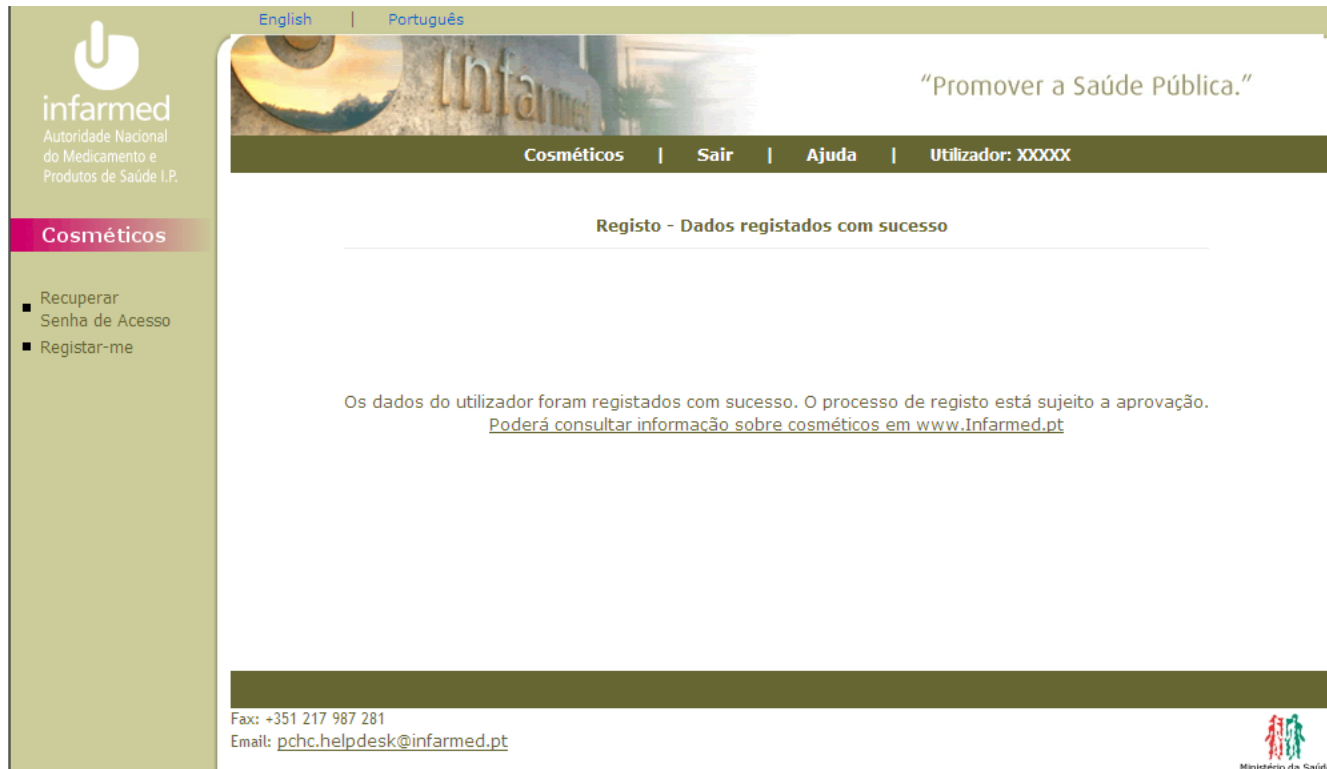
Ecrã 7 – Registo – Dados Registados com Sucesso